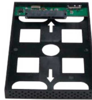
Châssis de maintien du disque dur