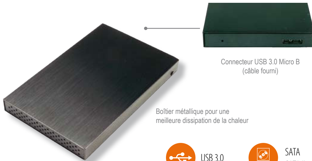
Connecteur USB 3.0 Micro B (câble fourni)

CARCASA EXTERNA PARA HDD DE 2,5" SATA / USB 3.0