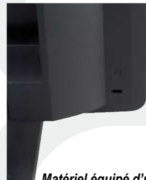
Matériel équipé d'une encoche de sécurité type Kensington