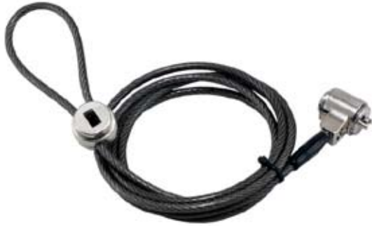
Câble en acier gainé Ø 4 mm