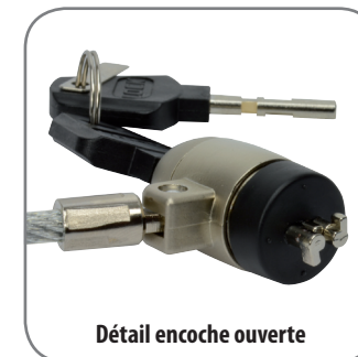
Détail encoche ouverte