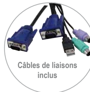
Câbles de liaisons inclus