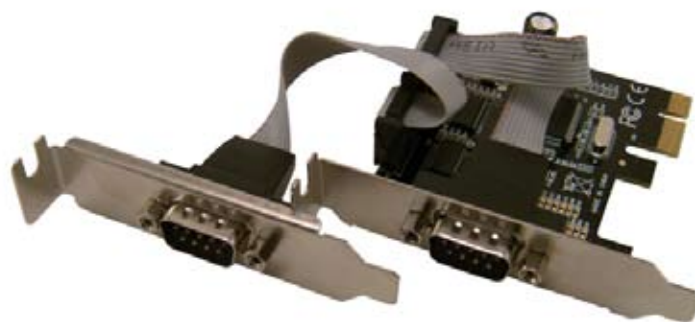
Montage avec réglettes «Low profile»